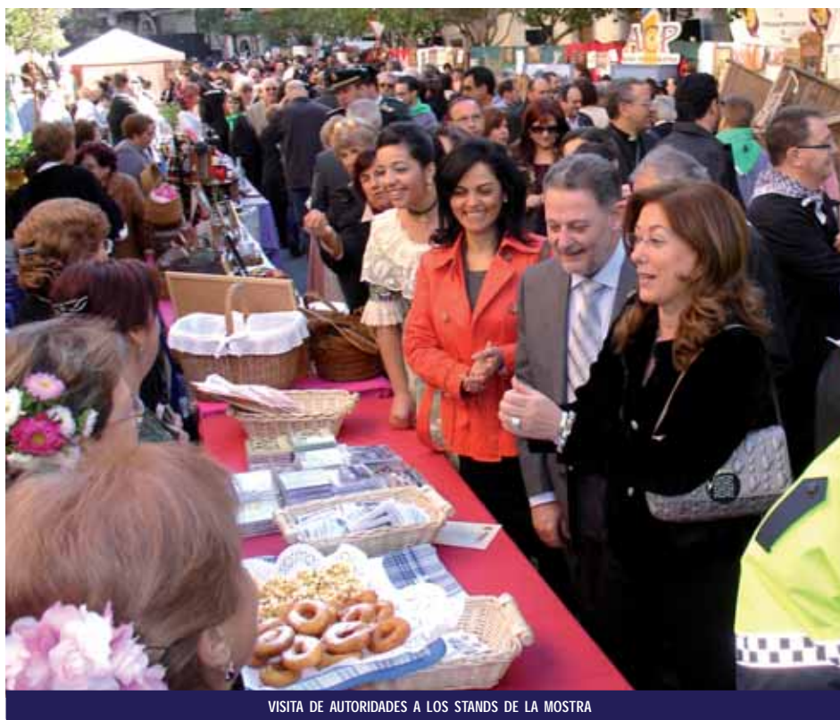
VISITA DE AUTORIDADES A LOS STANDS DE LA MOSTRA

Es esta una manera de reconocer la tarea de pensar qué exponer en esta jornada tan especial, encontrar los objetos más adecuados, o curiosidades que llamen la atención de pinoseros y visitantes. Eso sí, teniendo en cuenta siempre que este evento, pretende recuperar el sabor de antaño.