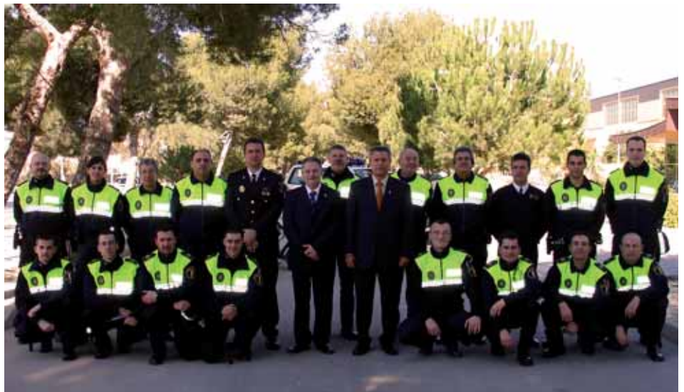
PLANTILLA DE POLICÍA LOCAL AL COMPLETO JUNTO A AUTORIDADES

Por tanto, a partir de ahora, la plantilla la forman 19 agentes, dos de ellos con dedicación exclusiva a la vigilancia