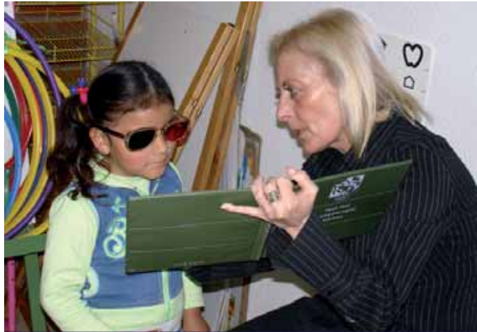
LA FUNDACIÓN JORGE ALIÓ VISITÓ LOS COLEGIOS REALIZANDO REVISIONES OCULARES