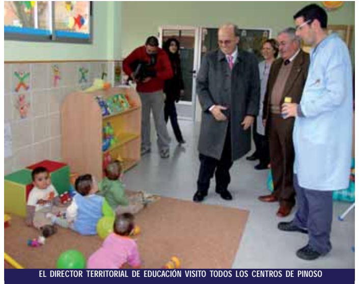
EL DIRECTOR TERRITORIAL DE EDUCACIÓN VISITÓ TODOS LOS CENTROS DE PINOSO