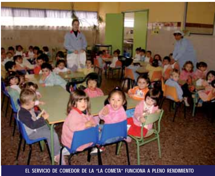
EL SERVICIO DE COMEDOR DE LA "LA COMETA" FUNCIONA A PLENO RENDIMIENTO