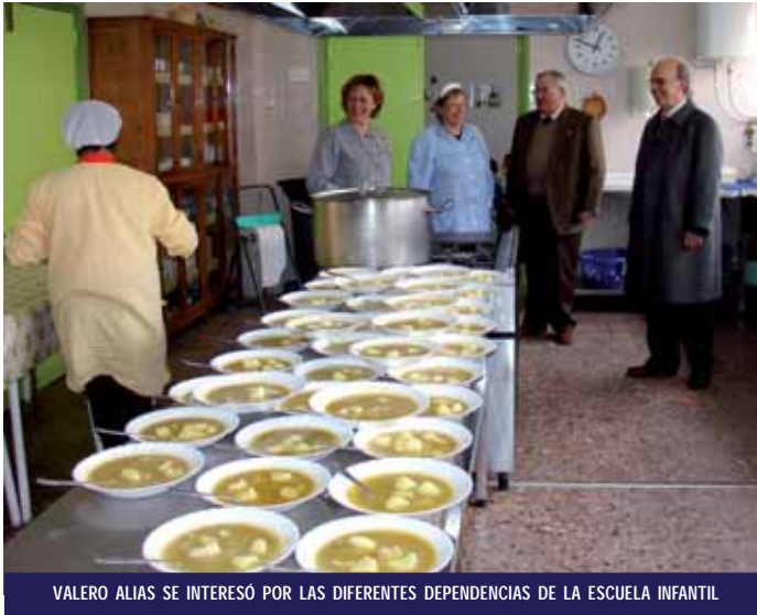
VALERO ALIAS SE INTERESÓ POR LAS DIFERENTES DEPENDENCIAS DE LA ESCUELA INFANTIL