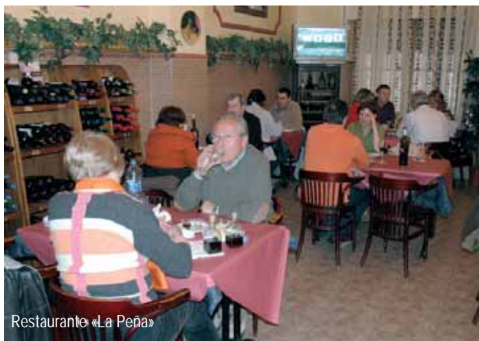
Restaurante «La Peña»

en prensa escrita, radio o a través de Internet, han sido también un factor fundamental a la hora de difundir la edición de este año.