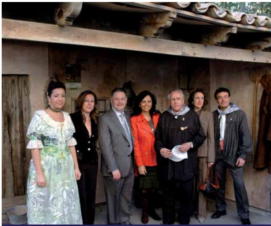
AUTORIDADES LOCALES, DIPUTADAS PROVINCIALES Y PREGONERO DEL VILLAZGO POSAN EN EL STAND DE «MONTE DE LA SAL»

Como es habitual, para deshacer los excesos del día, qué mejor que bailar con la música de «Tres fan ball», quienes nuevamente hicieron bailar a los visitantes que todavía estaban deseosos de disfrutar de la fiesta, o que les costaba despedirse de Pinoso por el buen ambiente que se respiraba. No sólo visitantes, sino también expositores y organizadores, que culminaban un día intenso con la satisfacción de que todo había salido a pedir de boca.