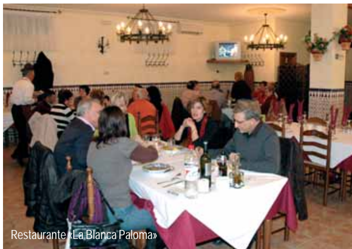
Restaurante «La Blanca Paloma»