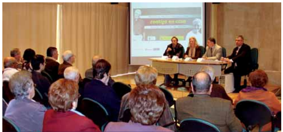
PRESENTACIÓN DE LA UDP DE LA CASA DOMÓTICA

En el acto de presentación se encontraban presentes varios dirigentes de la Unión Democrática de Pensionistas (UDP) a nivel provincial y nacional, así como miembros de la Asociación