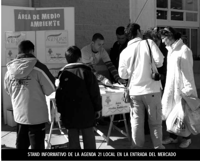
STAND INFORMATIVO DE LA AGENDA 21 LOCAL EN LA ENTRADA DEL MERCADO