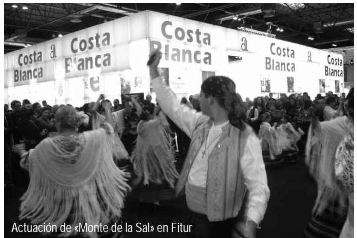
Actuación de «Monte de la Sal» en Fitur

Pinoso tuvo su protagonismo, como miembro de la Denominación de Origen de Alicante, entre las distintas variedades de la provincia se ofrecieron catas de los caldos pinoseros, dulce "Camps de Gloria" de Bodegas Sanbert y "Pontos Crianza" de la Bodega de Pinoso.