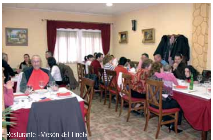
Restaurante -Mesón «El Tinet»