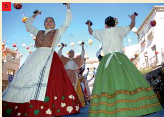
1 Actuación del grupo "Tres Fan Ball"