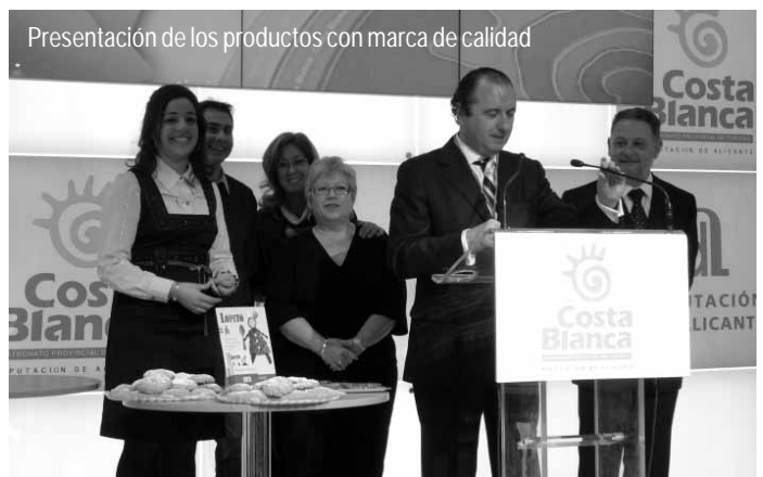
Presentación de los productos con marca de calidad