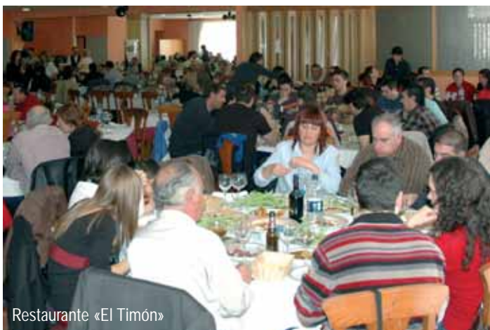
Restaurante «El Timón»

- El PSOE local invitó a importantes personalidades del partido, como el senador y expresidente de la Generalitat, Joan Lerma