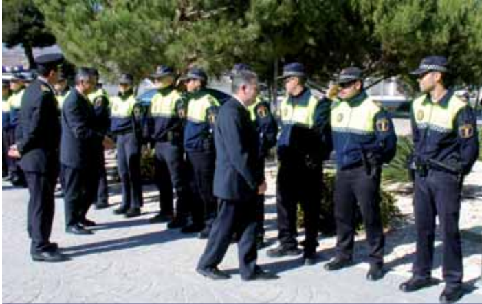
AUTORIDADES PASAN REVISTA A LOS AGENTES