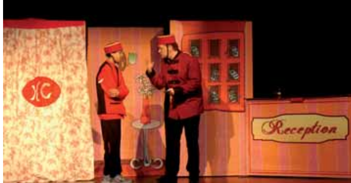
TEATRO EN INGLÉS PARA ALUMNOS DEL INSTITUTO

La representación provocó, en diversas ocasiones, las carcajadas del público, que no dudó, al final de la obra, ovacionarla durante varios minutos.