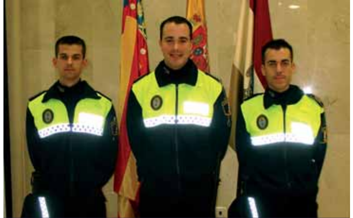
NUEVAS INCORPORACIONES EN EL CUERPO DE POLICÍA LOCAL