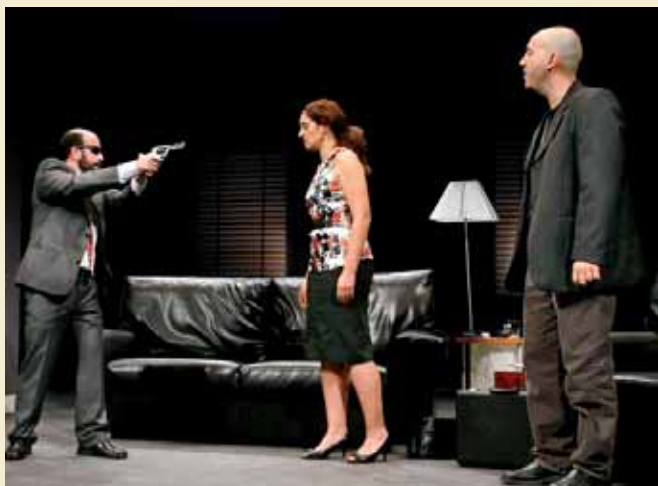
LA REPRESENTACIÓN DE FUGA GUSTO EN EL AUDITORIO