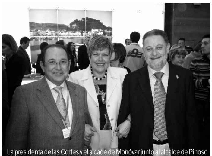
La presidenta de las Cortes y el alcalde de Monóvar junto al alcalde de Pinoso