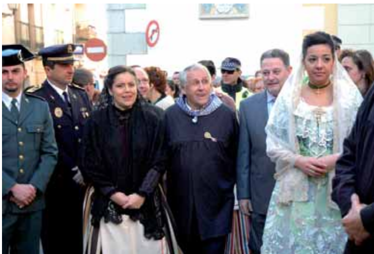
LA COMITIVA SE DIRIGE AL PORTÓN DEL VILLAZGO