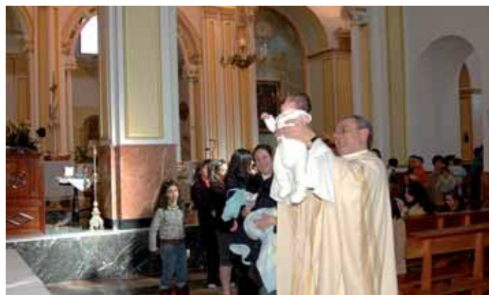
EL CURA DE PINOSO OFRECIO A LOS NIÑOS NACIDOS EN 2007 A LA VIRGEN DEL REMEDIO

Con motivo de la festividad de la Candelaria, el 2 de febrero, la parroquia de San Pedro Apóstol de Pinoso celebró la tradicional procesión en honor a la Virgen de la Candelaria, con el fin de cumplir la tradición religiosa en que los padres de Jesús de Nazaret, cuarenta días después del natalicio, lo llevaron al templo, en Jerusalén, para continuar el rito judío de realizar su presentación.